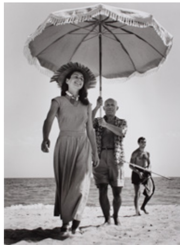
Foto: Goffe-Juan, France, August 1948. Pablo Picasso and Françoise Gilot. Photograph by Robert Capa / International Center of Photography, New York—Collection of the Hungarian National Museum